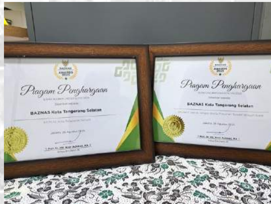
KATEGORI BAZNAS KOTA DENGAN ASSET FUNDRAISING TERBAIK