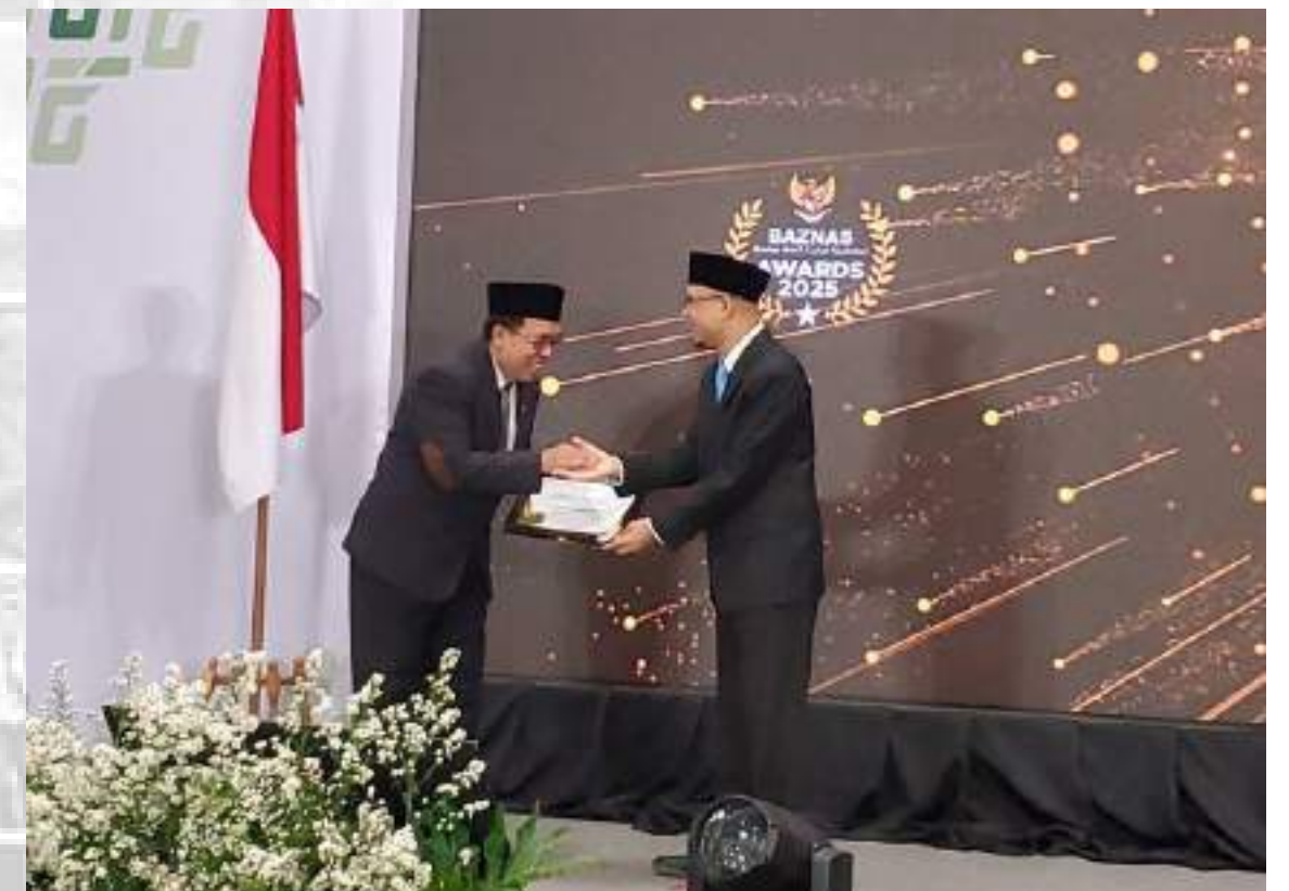
KATEGORI BAZNAS DAERAH DENGAN BERITA PIMPINAN TERAKTIF WILAYAH BARAT