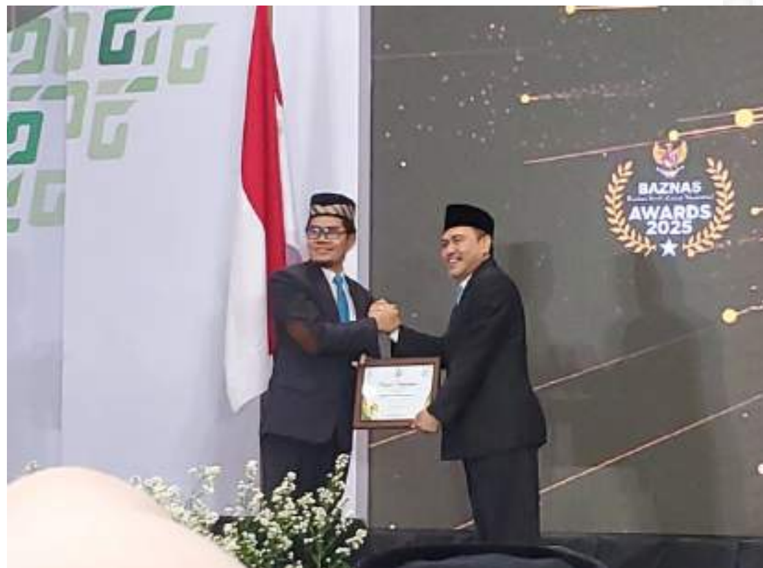
KATEGORI BAZNAS KOTA DENGAN PELAPORAN TERBAIK